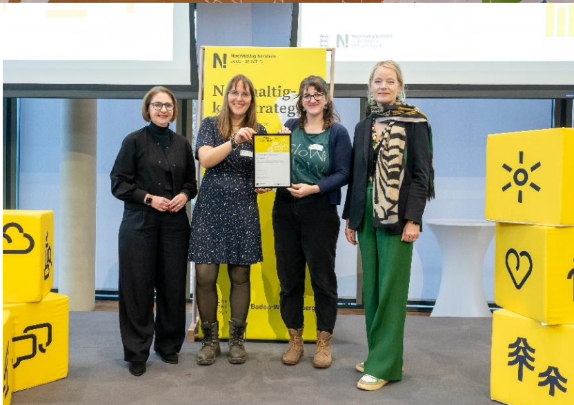
Verleihung des BNE-Zertifikates in Stuttgart durch die Umweltministerin Thekla Walker