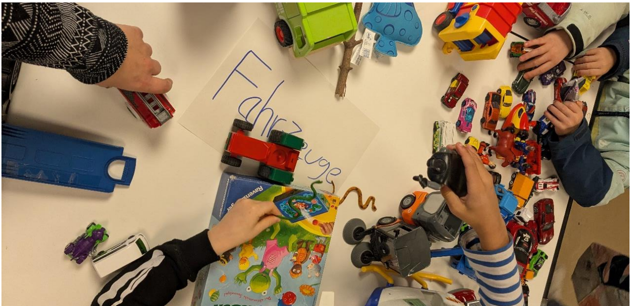
Kinder tauschen beim Spielzeugtausch

Der Spielzeugtausch im Dezember war unser großes Jahresfinale. Diesmal wählten wir hierfür eine Kooperation mit dem Kinder- und Jugendhaus Südwest und nutzten ihre Reichweite und Räumlichkeiten. Rückblickend war das ein großer Gewinn für uns beide. Viele Spielzeuge fanden ein neues Zuhause, es wurde zusammen vor Ort gespielt und mit UNICEF, dem Kinderschutzbund und unserem Team über Kinderrechte und Zukunftswünsche gerätselt und philosophiert.