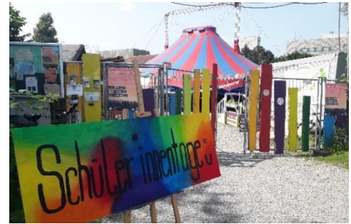
Schüler:innentage in Karlsruhe

Bis zu den Sommerferien kamen weitere Workshops an anderen Schulen, mit Studierenden und mit einer FSJ-Gruppe sowohl präsent als auch online dazu. Auch wurden wir zu den von Karlsruher Schüler:innen selbst organisierten Schüler:innentagen eingeladen, um das Thema Fast Fashion zu bearbeiten.