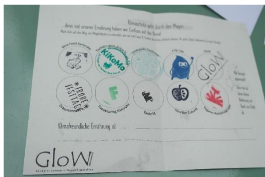
Stempelkarte für die Stände