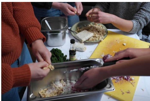
Kochkurs Klimafreundliche Ernährung

Die Veranstaltung „Aktionstag: Klima und Ernährung“, die am 23.10. in der Kulturküche stattfand, war zwar aufwendig zu organisieren, aber ein voller Erfolg! Zusammen mit zehn anderen Initiativen haben wir an Ständen die verschiedenen Aspekte einer klimafreundlichen Ernährung aufgezeigt. Es gab einen klimafreundlichen Kochkurs, Mitmachaktionen wie Apfelsaftpressen oder ein Saisonkalender-Rätsel sowie leckeres Essen der Kulturküche und der veganen Hochschulgruppe. Es kamen ca. 200 Besucher:innen, darunter viele Familien. Kinder, aber auch Erwachsene, zogen von Stand zu Stand, stellten sich dort den jeweiligen Aufgaben, um mit einem Stempel belohnt zu werden. Zusätzlich fand ein intensives Kennenlernen zwischen den verschiedenen Initiativen statt. Am Abend waren wir richtig K.O., aber auch sehr stolz und zufrieden.