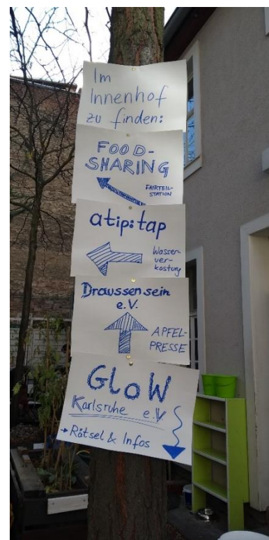
Wegweiser im Innenhof