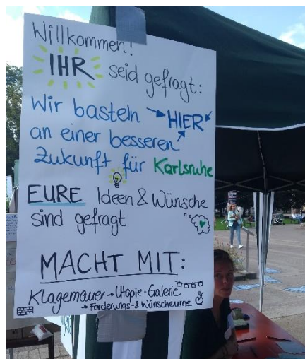
Rechts: Marlene bei der Zukunftswerkstatt am Friedrichsplatz

Zwar waren die Passant:innen noch etwas verhalten, jedoch konnten wir durch diese Veranstaltungen bekannter werden und lernten viele neue Kooperationspartner:innen kennen. Wir wurden zudem erstmals mit einem Artikel in der BNN erwähnt und auch im Stadtteilmagazin Karlsruhe vorgestellt! Den Artikel sowie weitere Bilder und Videos finden Sie auf unserer Website unter Rückblick ( https://glow-karlsruhe.org/rueckblick/ ).